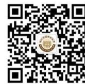
后勤微信公众平台