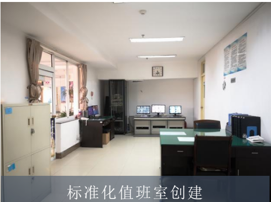
标准化值班室创建