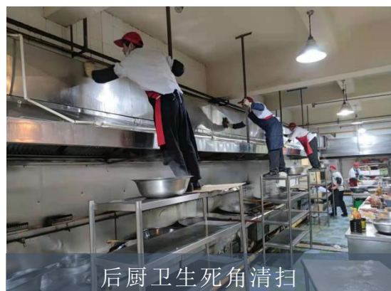
后厨卫生死角清扫