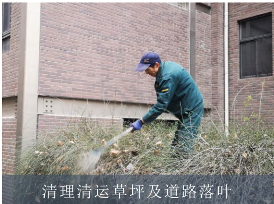
清理清运草坪及道路落叶

后勤各部门在思想上高度重视，在行动上狠抓落实，在完成常态化服务保障工作的基础上，科学谋划，以负责的态度、主动的精神和有效有力的举措，切实推进校园文明建设工作，确保文明校园创建工作落实落地。