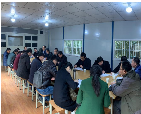
准备工作及召开会议

在此次收房期间,后勤服务中心共抽调30余名年轻同志投身到收房工作中,每天早上八点到晚上八点全天候的守护,全力做到“有问必答有求必应”。截止4月1日,共计收房1782户,余48户未收房。在学校各职能处室的配合及后勤领导的支持下,本次收房工作平稳有序的进行。接下来我们会继续用良好的服务态度为各位住户办理装修手续,同时做好日后的各项物业服务工作!