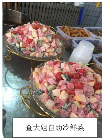
查大姐自助冷鲜菜