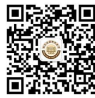
后勤微信公众平台